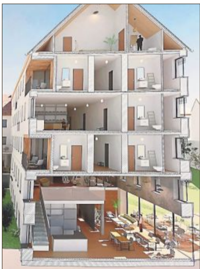
Blick ins Innere eines Entwurfs.

Qualitativ hochwertiger Lebensraum könnte auch in dem 1906/07 erbauten JVA-Gebäude entstehen, aber eben bezahlbar bleiben für Menschen mit schmalen Einkommen. Gleichzeitig sei es möglich, das Wohnbauprojekt klimaneutral umzusetzen und noch dazu eng mit der Stadt zu verbinden. „Diese Arbeiten zeigen eindrucksvoll, wie wir historische Gebäude für die Herausforderungen unserer Zeit transformieren können,“ sagte Bauriedel.