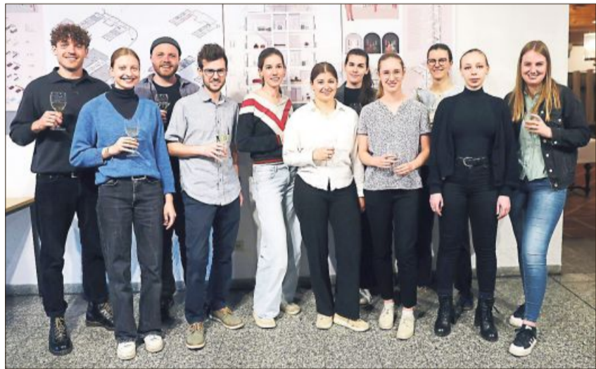
Die Studierenden präsentierten im Rathaus ihre Entwürfe.

Die detaillierten Entwürfe umfassen denkmalgerechte Umbaupläne mit minimalen Eingriffen in die historische Bausubstanz, innovative Energiekonzepte für einen klimaneutralen Betrieb, flexible Wohnungsgrundrisse für unterschiedliche Bedarfe, Gemeinschaftsflächen