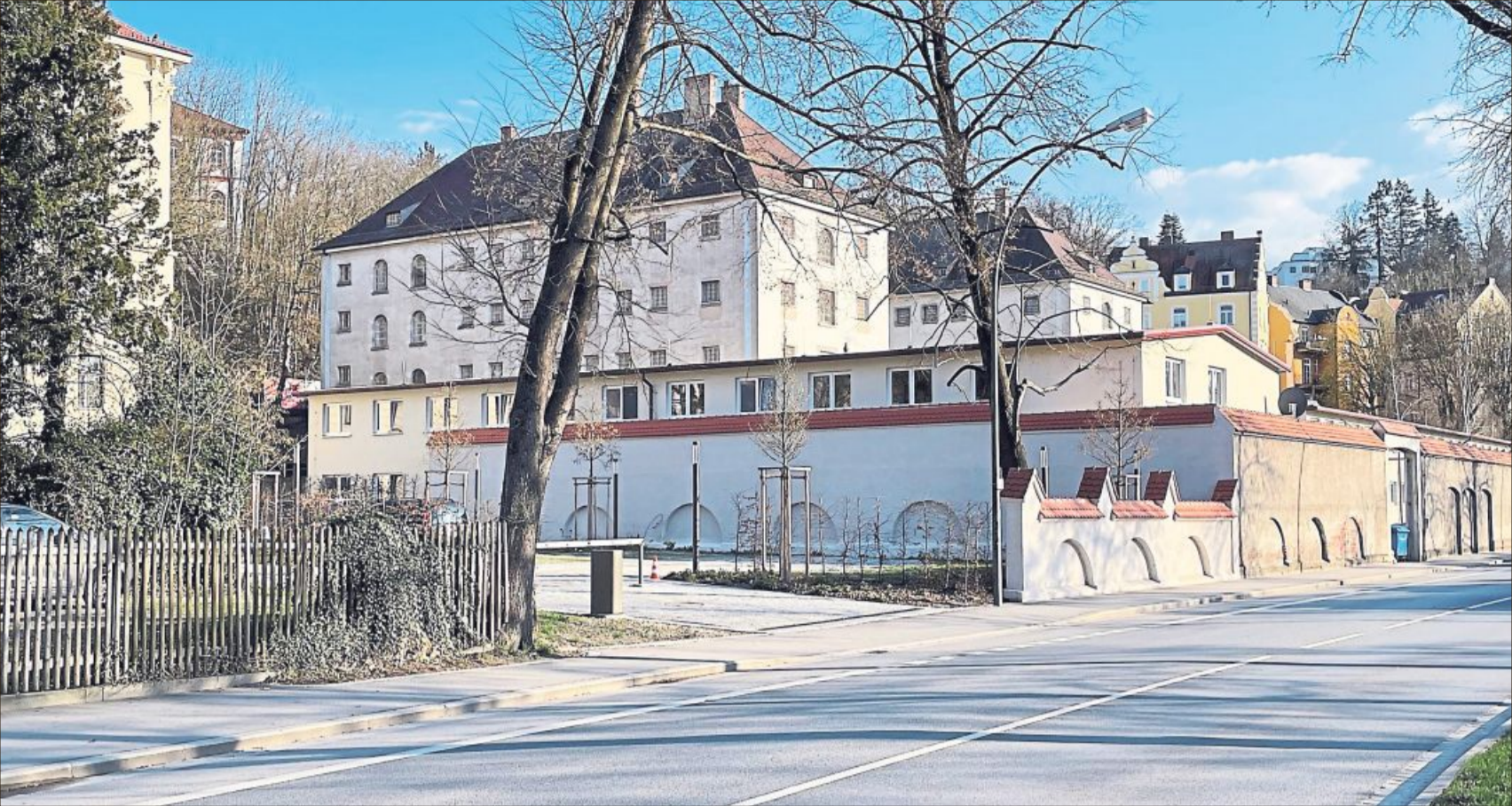
Hätte das Potenzial, zu einer „Fuggerei“ in Landshut zu werden: die ehemalige Justizvollzugsanstalt.